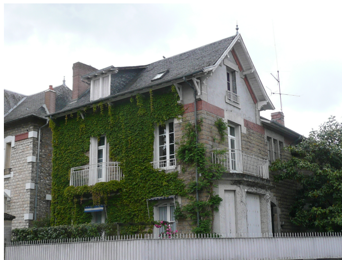
villa individuelle 1920-1940 20 Avenue Bourzat