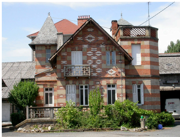
Villa 1900-1920 ( type 8) 73 Avenue Maillard villa caractérisée par sa polychromie de matériaux, les décor de façades ainsi que les jeux de volumes