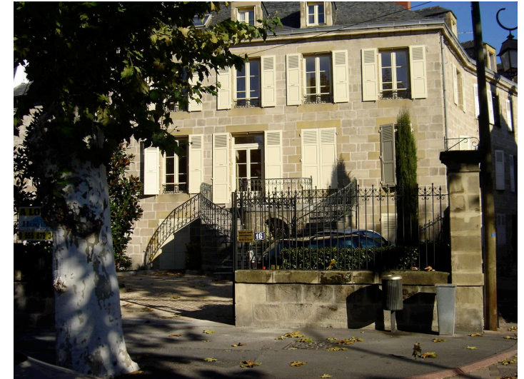
maison bourgeoise 16 Bd Edouard Lachaud 1883 Construction d'un ensemble constitué d'une maison résidentielle et d'un immeuble. La maison se prolonge au-dessus du porche. Superbe escalier extérieur.