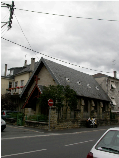
Temple protestant 1890-1891 13 rue Bertrand de Born