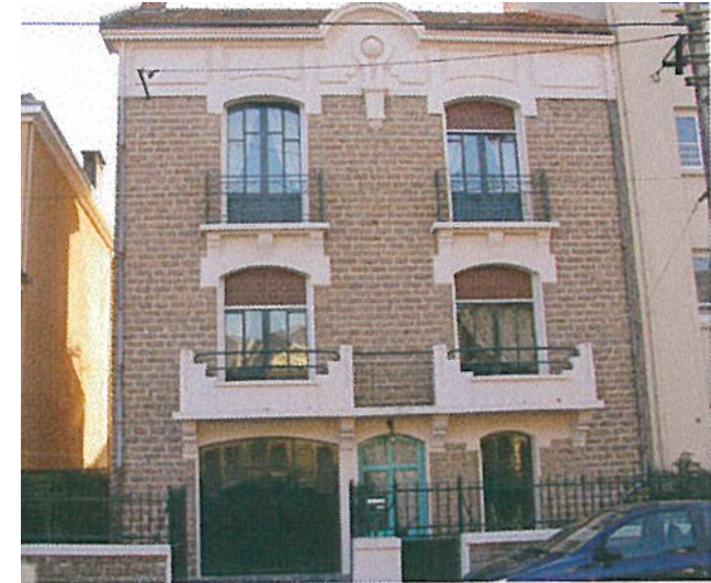
Immeuble 4 rue Léon Cladel -1935-1940 Petit immeuble des années 1940 avec encadrements en béton et travail décoratif de façade en partie supérieure.