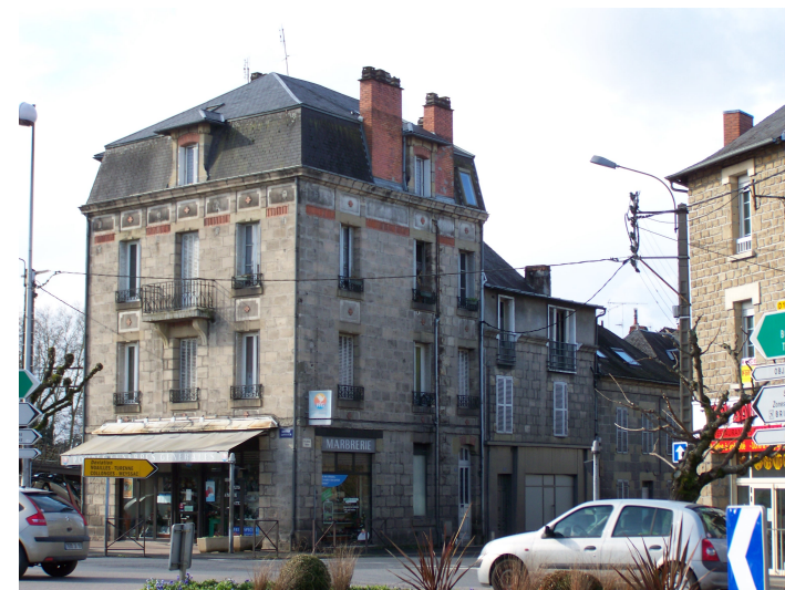
1 avenue Turgot début XXème s. Immeuble important par sa position dans le carrefour