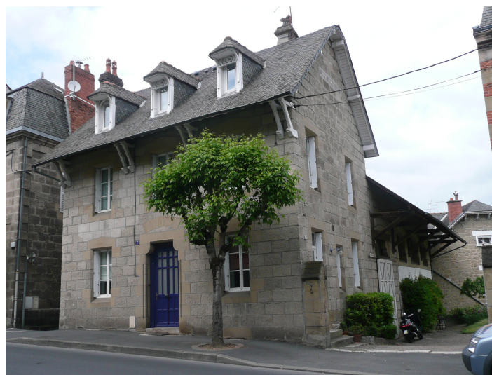
7 Boulevard Clémenceau fin XIXème siècle lucarnes meunières