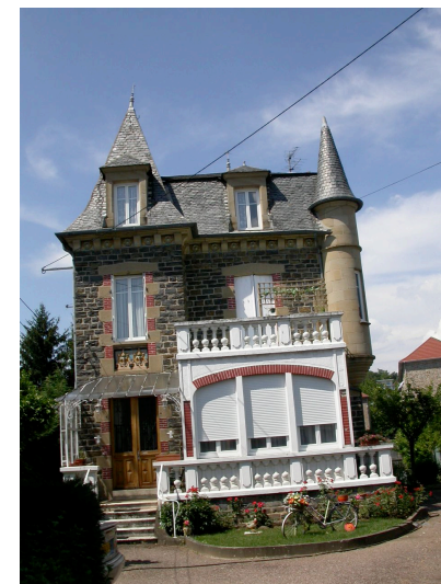
Villa 1900-1920 ( type 8) 81 Avenue Maillard Villa typique du début du siècle avec incrustation de motifs et utilisation de matériaux divers. Présence d'une tourelle. L'extension, quant à elle, est à retravailler.