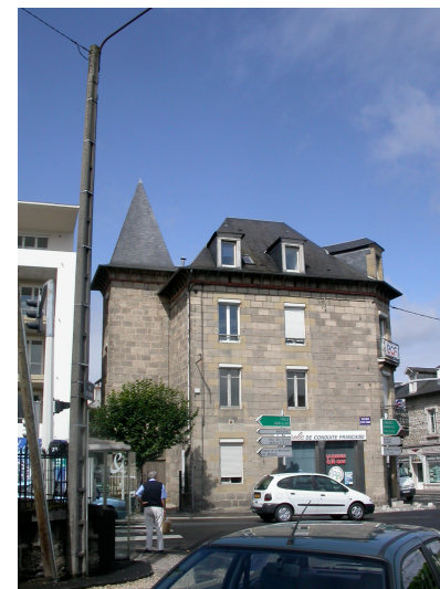
1 avenue Pierre Sémard