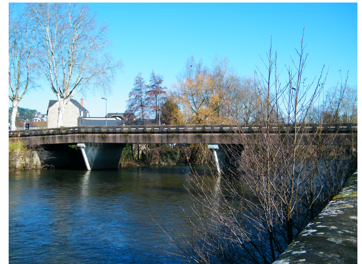
Pont de Tourny Quai de Tourny