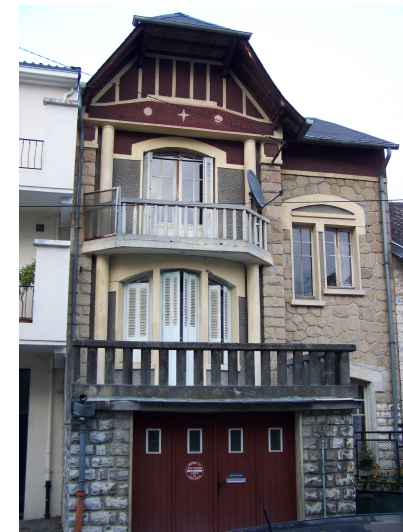
Villa simple des années 1920-1940 (type 11) rue Ernest Rupin