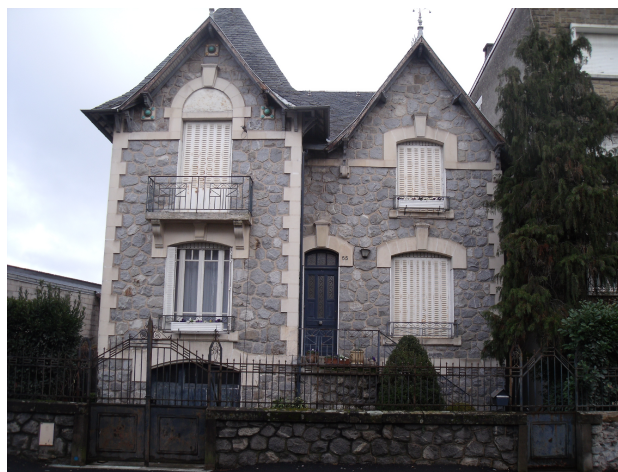
Villa individuelle 1920-1940 55 avenue Georges Pompidou