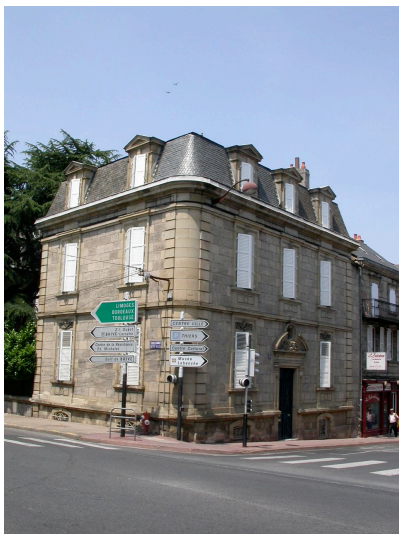
Maison VAN HOECK ( type 7) 38 Av. Jean Jaurès 2ème moitié du XIXème siècle. Maison avec de superbes masques sculptés en grès permien au- dessus des ouvertures.