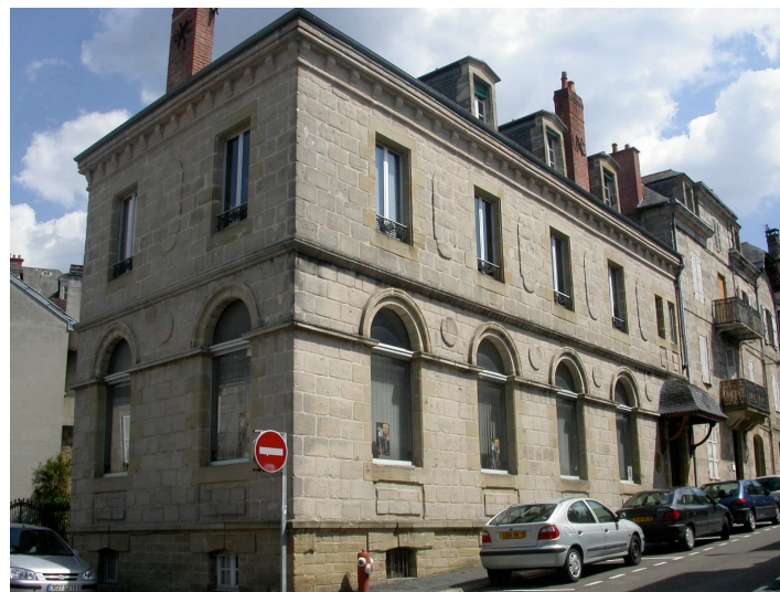
Bâtiment de l'Union Compagnonnique 17 bis avenue Treilhard