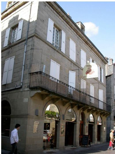
immeuble post-haussmannien 16 rue Majour 1856 - Charles Albrizio Belles arcades en RDC