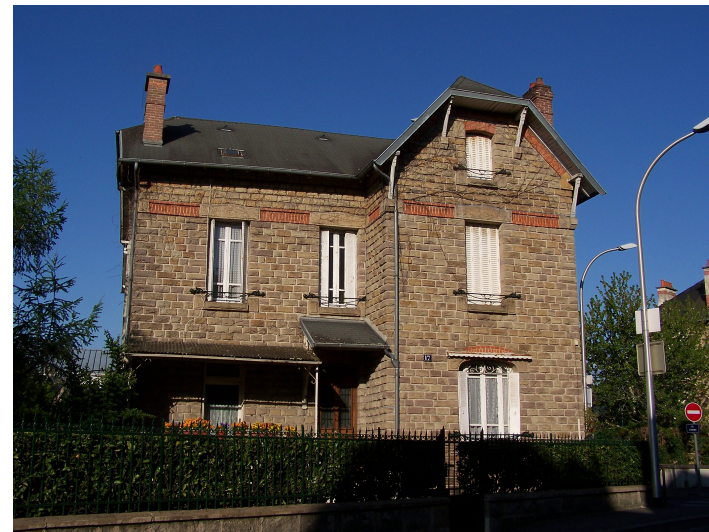
17 Avenue Louis Pons Ferronneries Guimard