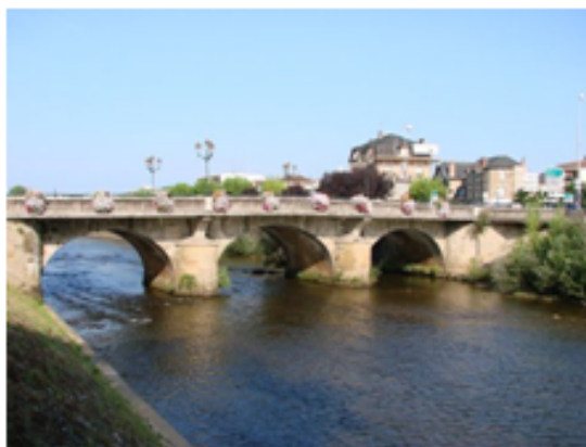
Pont Cardinal Carrefour Carriven