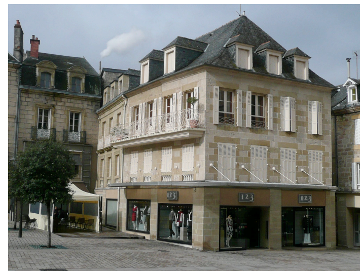
6 place des Patriotes Martyres