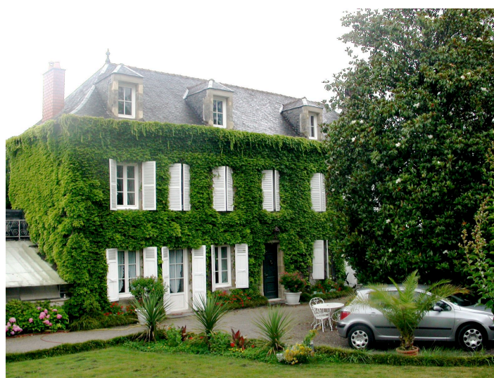
Maison bourgeoise 1900-1920 48 Av. Pierre Sémard Maison située en retrait par rapport à la rue.