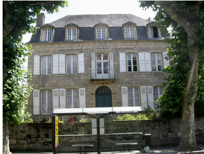
Hôtel particulier de la famille Montet 3 Bd Maréchal Lyautey XVIII ème siècle Proportions harmonieuses Beau jardin tout autour du bâtiment malgré sa position urbaine.