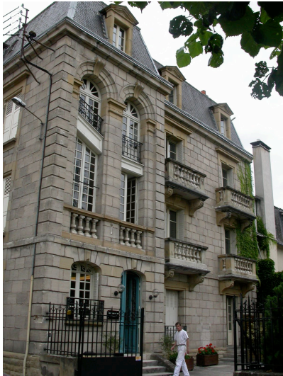
Annexe de l'Hôtel Montauban 3 avenue Edouard Herriot 1930-1940 Très beaux volumes donnant sur le jardin; façades très ravaillées avec matériaux de qualité