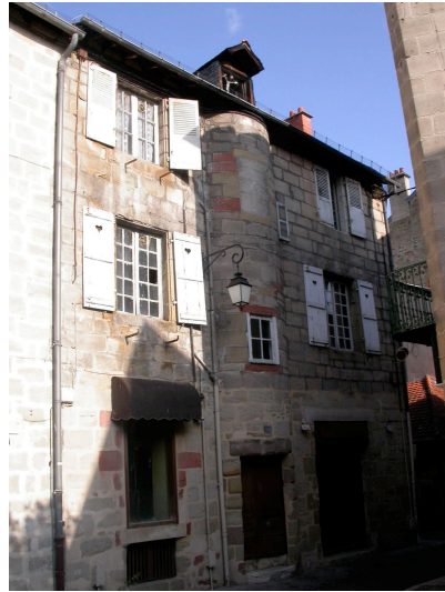
Maison 29 rue de la Jaubertie XVII ème siècle maison desservie par un escalier en vis placé en demi-hors-œuvre et ouvrant directement sur la voie.