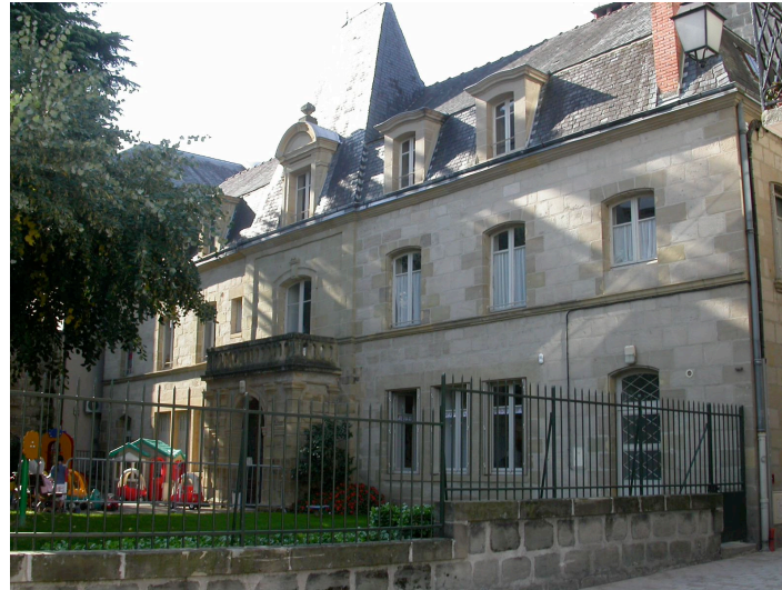
Hôtel particulier 3 rue Paul-Louis-Grenier XVIIIème siècle- Henri Clapier ? A la fin du XIXème siècle, la partie centrale est remaniée par l'ajout d'une entrée monumentale