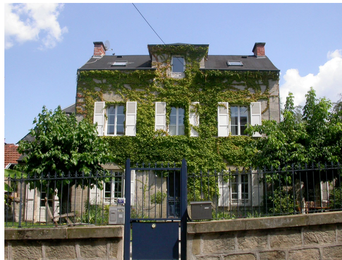
maison bourgeoise 5 bis rue Dumyrat Début du XXème siècle Proportions harmonieuses, beau jardin