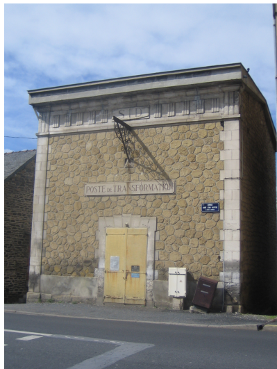
Poste de transformation Avenue Abbé Jean Alvitre Construit par l'Entreprise Labodinière