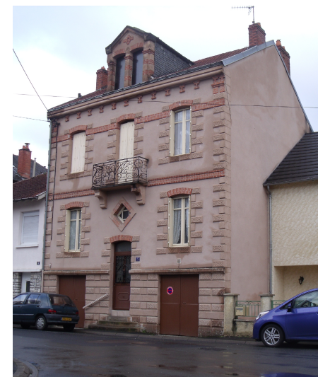
Villa individuelle 5 rue Frédéric Mistral Lucarne et ferronnerie garde-corps Conservation double lucarnes passantes