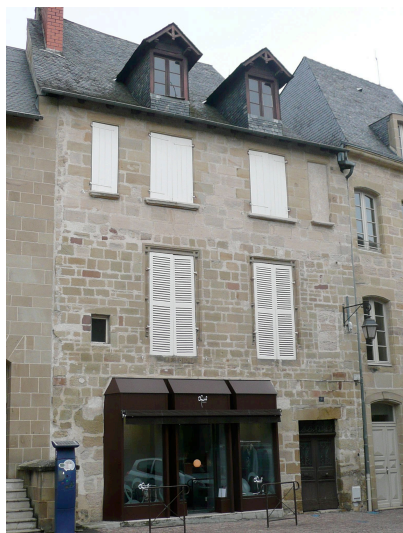
9 rue des Prêcheurs XVI ème siècle Remanié au XIX ème s. Rajout des 2 lucarnes. Baies du 1 er étages: moulures croisées.