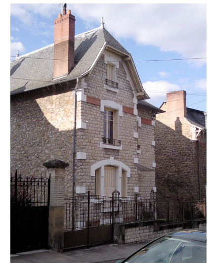
villa individuelle 1920-1940 22 Avenue Bourzat