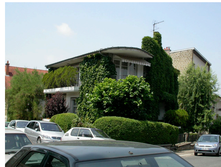
Villa individuelle contemporaine 8 rue Paul Claudel Villa avec couverture en zinc de forme ovale nous faisant penser à un paquebot...