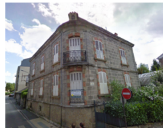
19 rue Fernand Delmas Immeuble d'angle