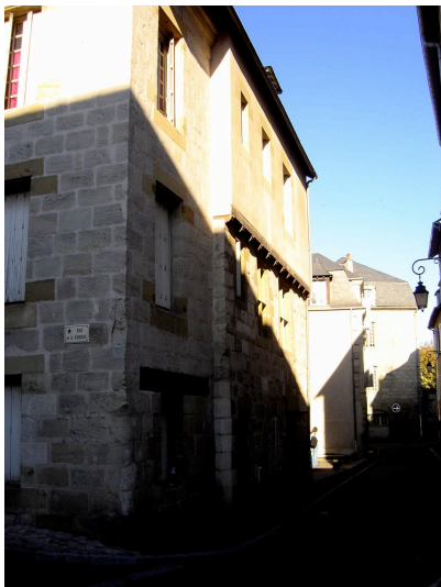
11 rue Basse XIIIème, fin XVème-début XVIème et XIXème siècle maison restaurée en 1996 permettant de retrouver la disposition des baies du 13 ème siècle. Pan de bois au 2ème étage.