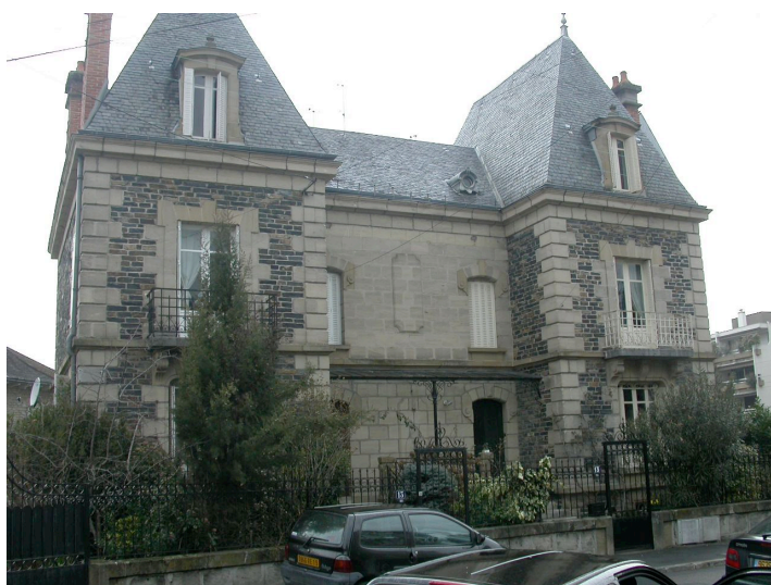
Villa double 1900-1920 (type 9) 13 bis & 13 ter rue Ségéral Verninac