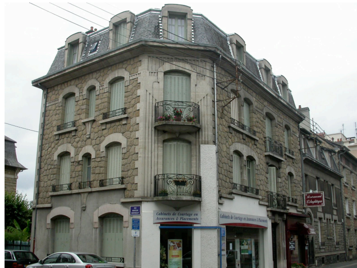
maison bloc 12 av. Alsace Lorraine 1938-1940