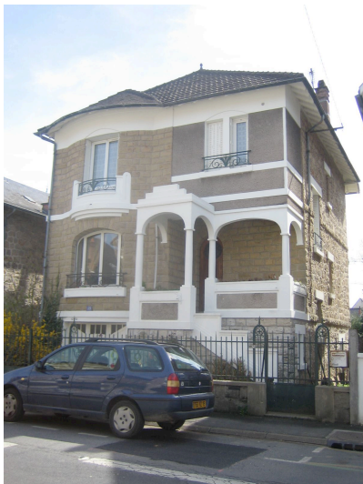
18 rue Benjamin Delessert 1920-1940