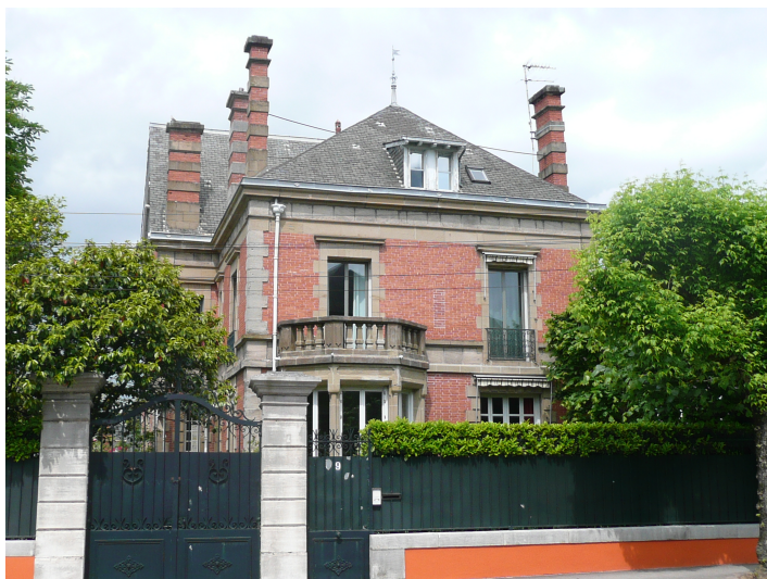
9 Boulevard Docteur Marbeau début XXème siècle gouttière décorée