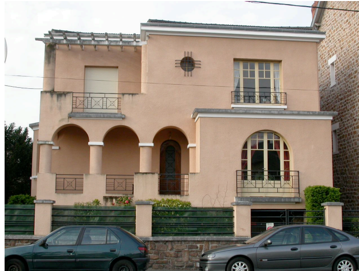
Villa 6 rue Léon Cladel -1957 Jean Prunetti Villa rénovée de style méditerranéen ( péron couvert d'arcades sur colonnes, grande baie en plein centre, façade en retour, terrasse au 2ème niveau)