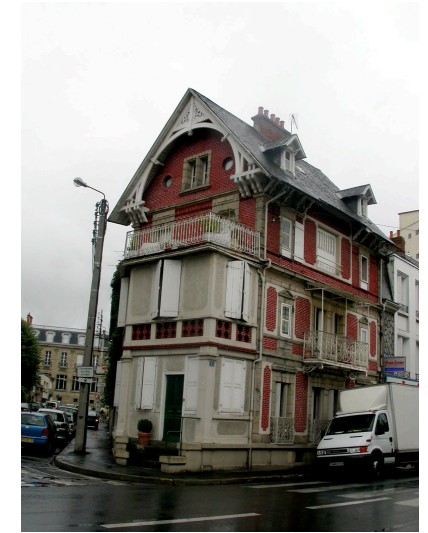
Villa Beynié 1 Av. du président Roosevelt Villa 1900-1920 villa caractérisée par sa polychromie de matériaux; faisant référence aux constructions balnéaires, mais angle modifié de manière peu esthétique.