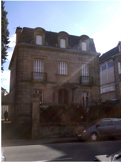
Petit hôtel particulier 9 ter Av du président Roosevelt Fin XIXème s, début XXème