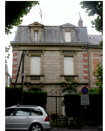
Maison bourgeoise 1900-1920 3 Bd Général Koenig Bâtiment très décoré