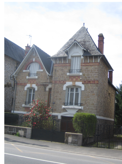
villa individuelle 1920-1940 37 boulevard Amiral Grivel