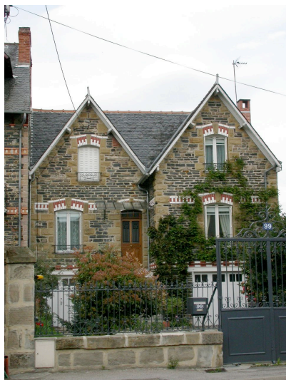
Villa individuelle (type 8) 99 Av. Alsace Lorraine 1924-1925 Polychromie des matériaux créant des décors de façade