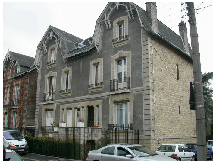
Villa double 1900-1920 (type 9) 11 rue Ségéral Verninac