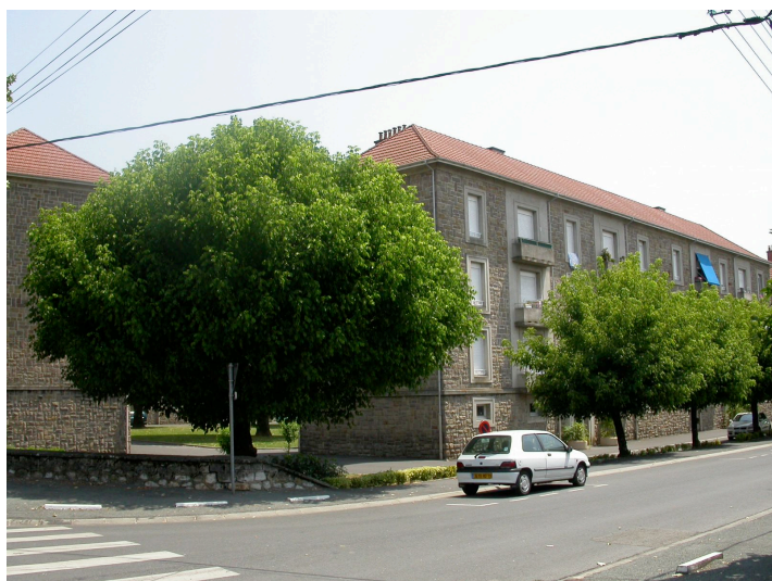
Cité MAILLARD Bld Max Dormoy 1949-1954 Premières constructions HLM à Brive