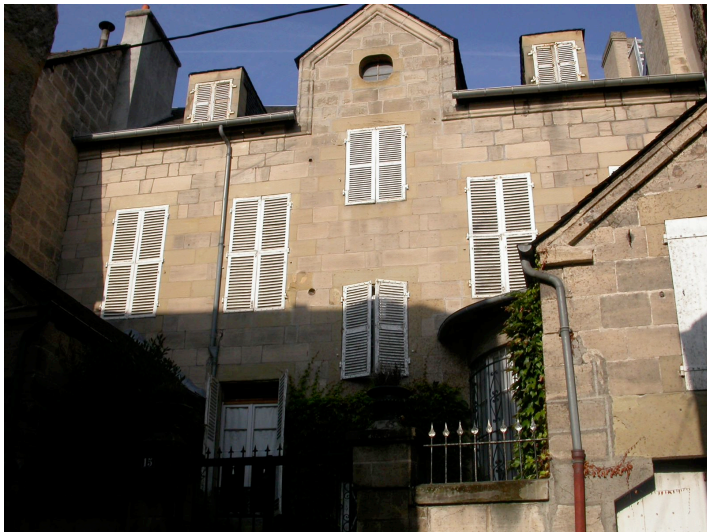
Petit hôtel particulier 15 rue de la Jaubertie/16, Bd Général Koenig 1857 Construction d'esprit classique à 2 façades ordonnancées