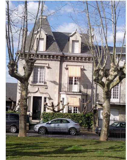
villa individuelle 1920-1940 17 square Gaston Hylaïre