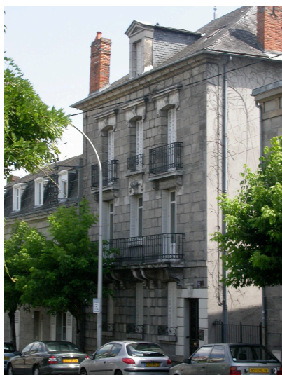
Maison bloc 12 bis Bd Clémenceau 1920-1940 Beau bâtiment bloc avec des encadrements de fenêtres décorés, harmonie des couleurs.