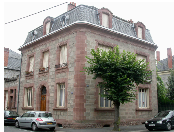
maison bloc 22 rue Colonel Jean Delmas 1930-1940