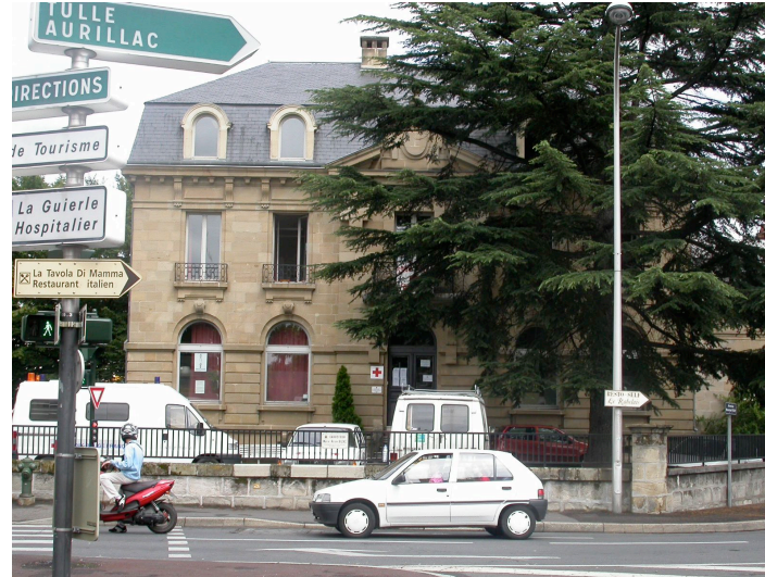
Bâtiment de "la croix rouge française" 3 avenue du 14 Juillet 1917 Hôtel particulier reconstruit sur les mêmes fondations et dans un volume identique que le très bel hôtel particulier de la famille Le Clère, détruit en 1914; reconstruit, cependant, dans un goût différent, un peu plus chargé. .