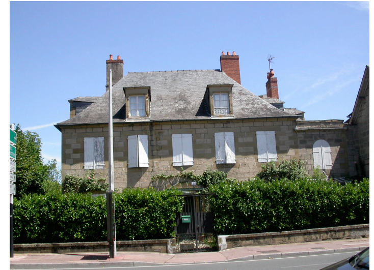
"Chartreuse Tassin" 38 bis avenue de Paris Hôtel particulier - fin XVIIIème siècle Celui-ci a été en grande partie reconstruit au XIX ème siècle.