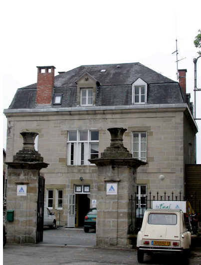
Hôtel particulier XIX ème siècle Angle Av. M. Bugeaud et Bd Voltaire