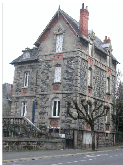
32 Bd Colonel Germain Villa individuelle 1900 - 1920 Villa typique du début du XXème siècle remarquable par la variété des matériaux utilisés, et le jeu de composition de la façade.