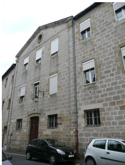
11 & 13 rue Blaise Raynal