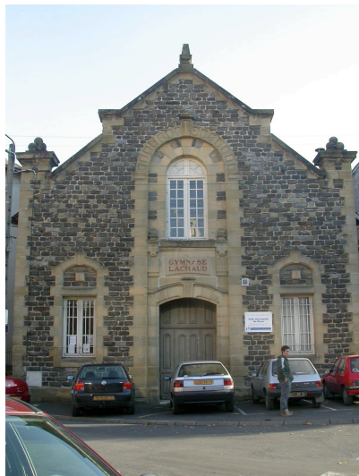
Gymnase Lachaud 23 rue Jean Fieyre 1913-1920 Dessin de façade très intéressant