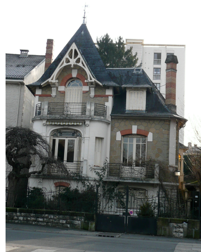
Villa individuelle 1930-1940 16 Quai de Tourny Villa rappelant les villas balnéaires