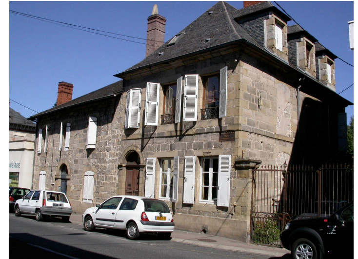
Maison de caractère 13 et 15 Avenue Edouard Herriot Fin XIXème siècle