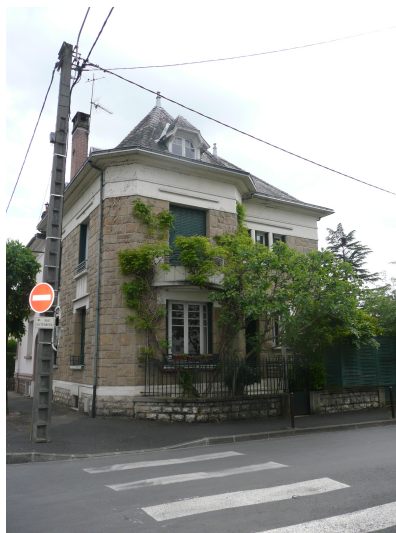
16 rue Gutenberg milieu XXème siècle