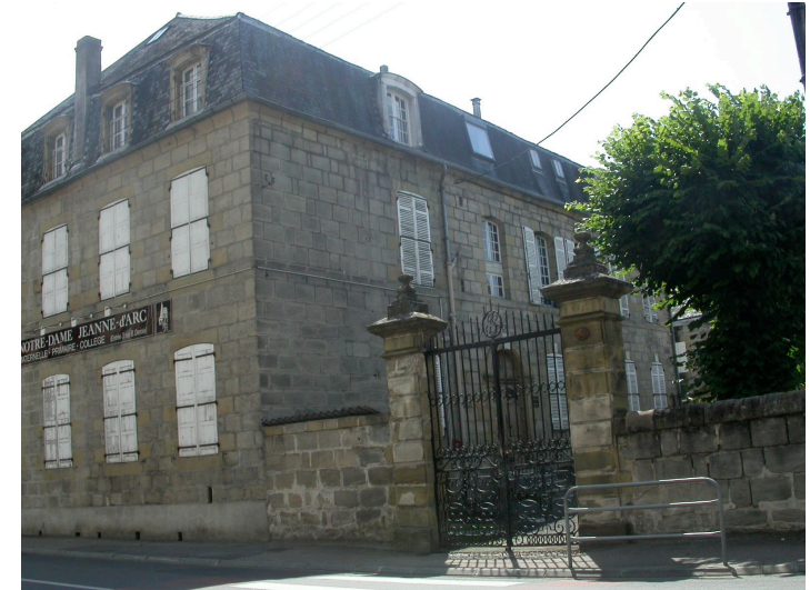
Ecole Notre-Dame Jeanne-d'Arc 12 Av Edouard Herriot Hôtel particulier du XVIIIème siècle.