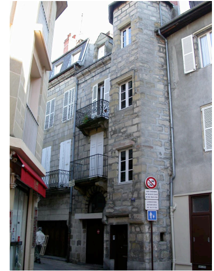
maison 14 rue Saint-Martin XVI ème siècle escalier en vis donnant sur la rue