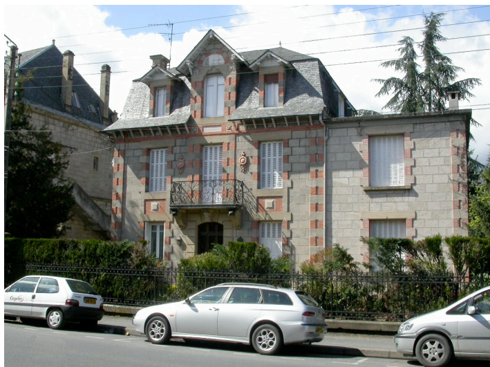
Maison bourgeoise 1900-1920 28 Av. du président Roosevelt Polychromie des matériaux et décors de façade sculptés