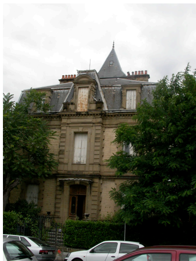
Ancien Hôtel du Parc 17 rue Dumyrat début du XXème siècle