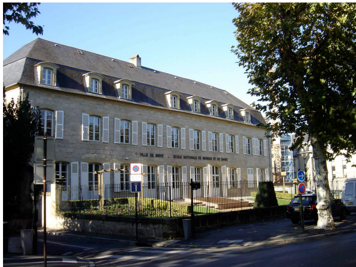
26-28 Boulevard du Salan Fin XVIIIème siècle