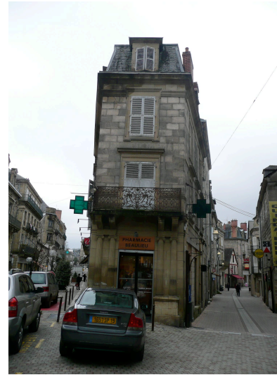
2 rue de l'Hôtel de Ville 1880 Dumas Denys-Joseph