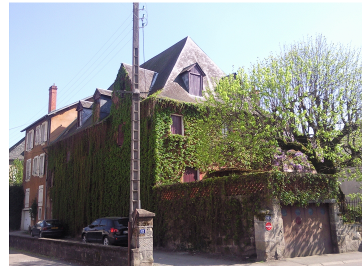
Demeure particulière Tracé ancien du couvent des Jacobins 10 avenue Maréchal Foch