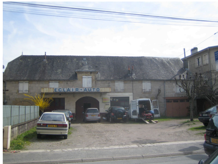
1bis Avenue de la Bastille