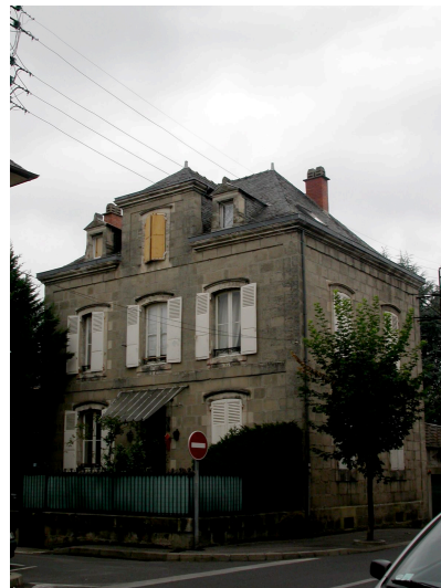
Maison bourgeoise Début du XXème siècle 7 Avenue Maréchal Bugeaud