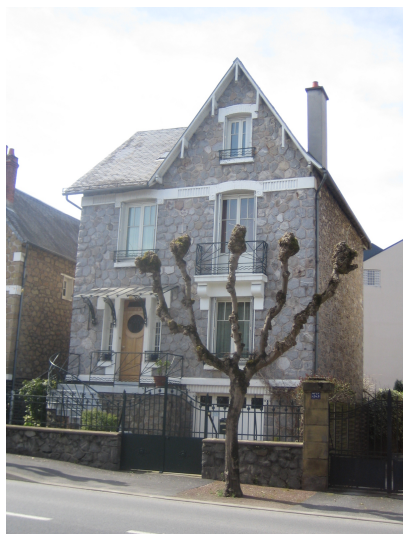
villa individuelle 1920-1940 33 boulevard Amiral Grivel