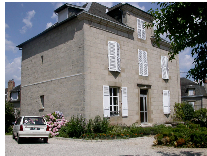
Petit Hôtel particulier 15 rue de la Fontaine Bleue