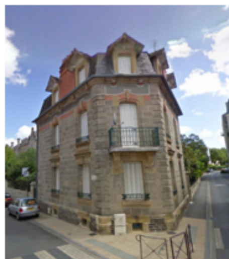
2 rue Fernand Alibert