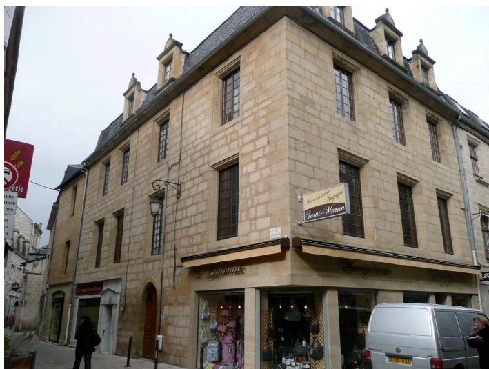
14 rue Colonel Farro, rue saint Martin - 1875 Ancien hôtel particulier constitué d'un corps central et de deux ailes en retour sur une cour et un jardin. Les fenêtres sur rue du 14 rue Colonel Farro avaient des menuiseries anciennes à quatre volets intérieurs disparues en 1980.