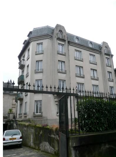
18 boulevard Général Koenig 1930 Construction en béton