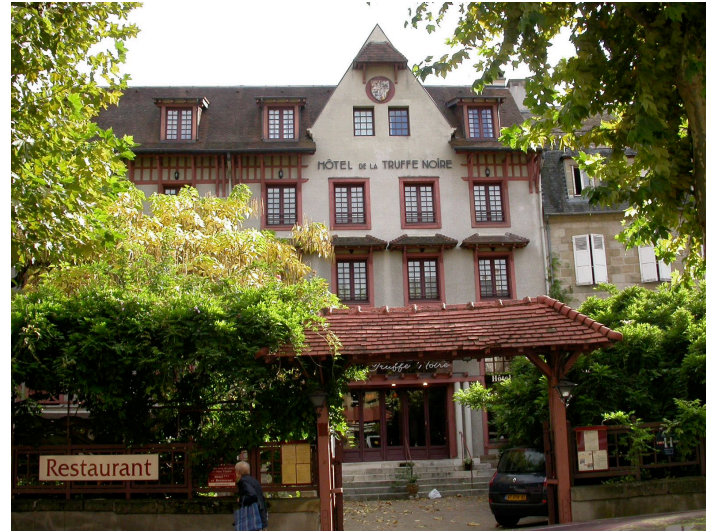
Hôtel de la Truffe-Noire (anciennement Hôtel Cotton) 22 Bd Anatole France 1893 Les architectes Macary père et fils travaillèrent à sa modernisation avec un style "basque" avec bois apparent. L'hôtel est restauré en toiture et partie haute en 1992 suite à un incendie.