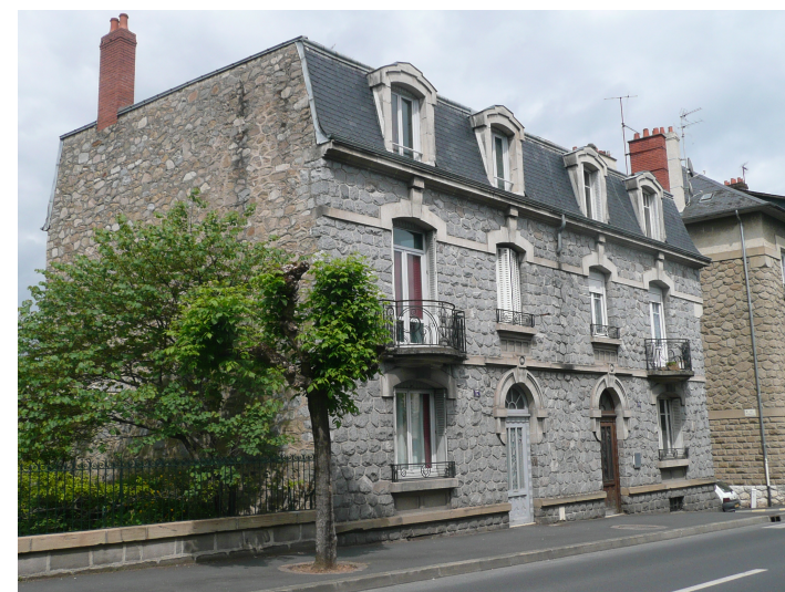
17 & 19 Boulevard Clémenceau 1920-1940