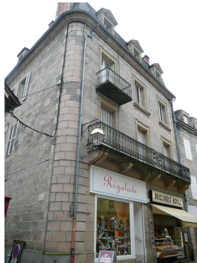
32 rue de la République