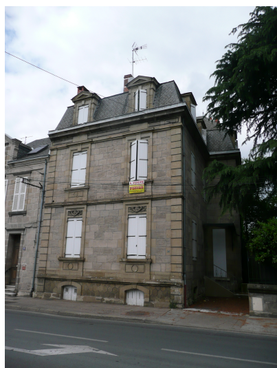
17 Boulevard Docteur Marbeau début XXème siècle linteaux sculptés (visages humains)