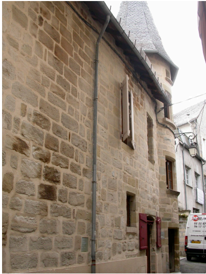
maison 32 rue de Corrèze XVI ème siècle et milieu du XIX ème . Escalier en vis placé en demi-hors- d'œuvre et ouvrant sur une impasse. Façade sur rue plaquée sur fonds anciens.