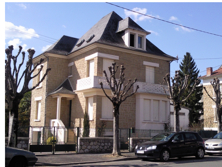
23 bis avenue Michel Labrousse