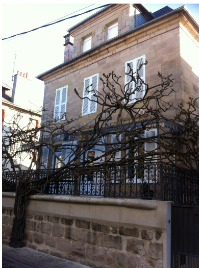
2 rue Bédoch