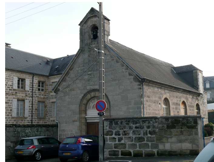
Chapelle Dumyrat rue Dumyrat Petite chapelle faisant partie du domaine Champanatier, et légée à l'hospice de Brive en 1830.