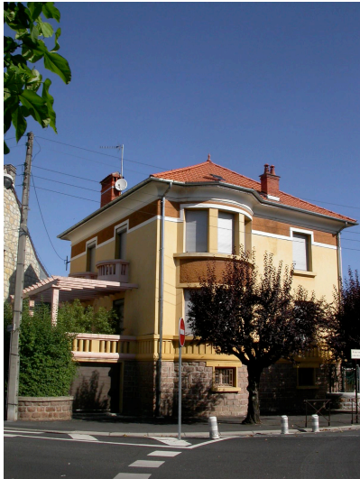
Villa 1 rue Séverine Villa très colorée avec des références aux constructions balnéaires ( pergolas,...)