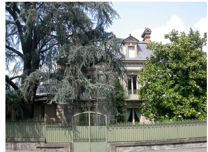
Hôtel particulier 29 Bd Clémenceau XIX ème siècle Très beau jardin tout autour du bâtiment malgré sa position urbaine.