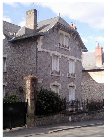
villa individuelle 1920-1940 24 Avenue Bourzat