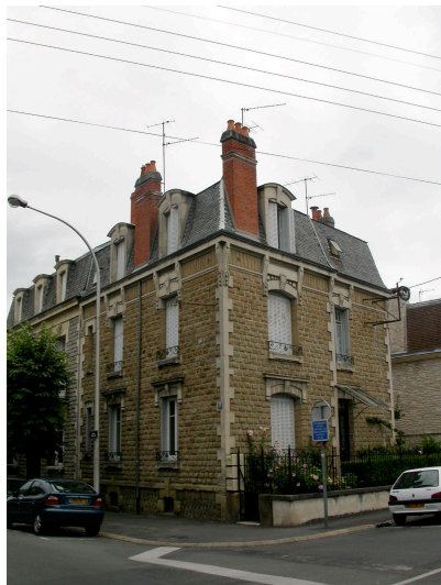
maison bloc 13 av. Poincaré 1925- Prosper Verlhac