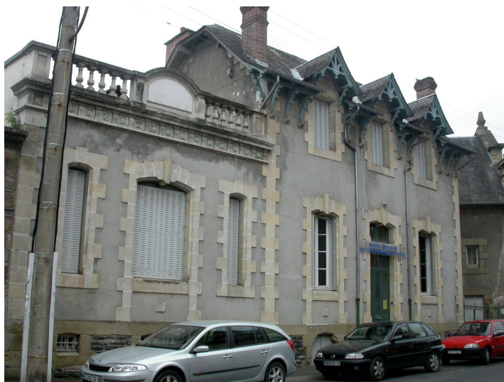
villa simple 25 rue Jean Fieyre 1920-1940 maison avec une toiture terrasse, des décors incrustés et des lucarnes pendantes faisant parfois référence à une architecture balnéaire