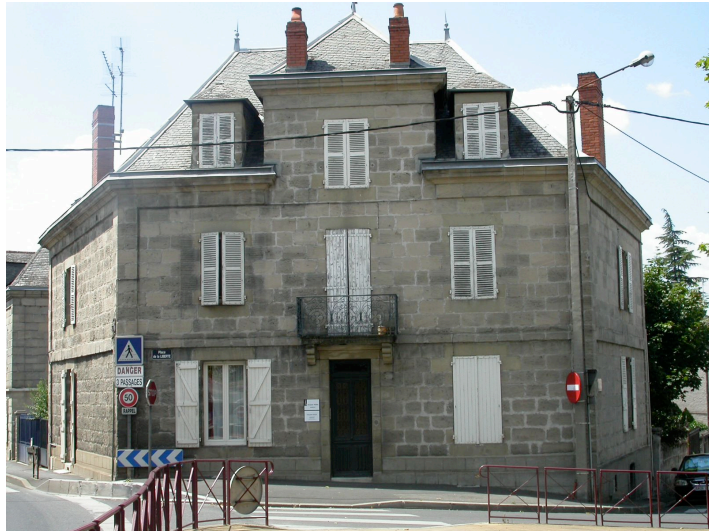
Maison en brasier avec lucarne passante 13 Place de la Liberté Fin du XIXème siècle Bâtiment repère, en position d'angle, donnant directement sur la place