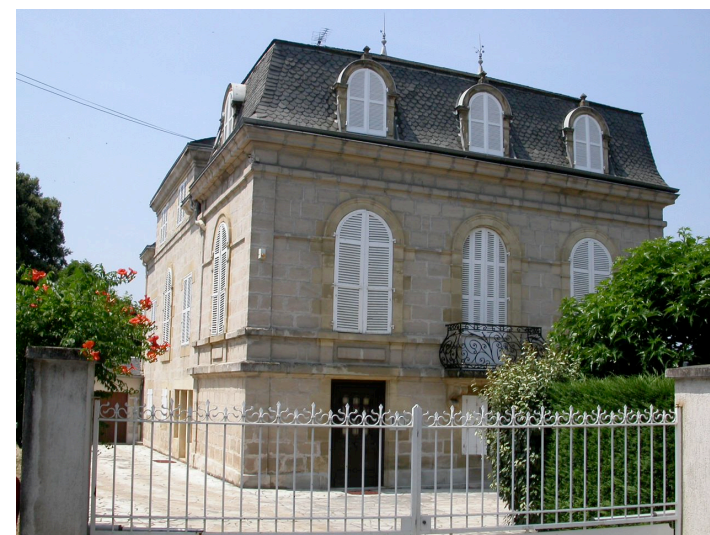
Hôtel particulier 20 rue Dumyrat XVIII ème siècle Ouverture cintrées Beau jardin