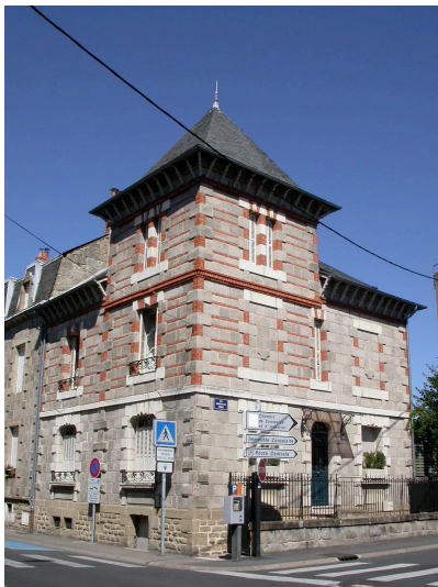
Demeure particulière 11 Av Edouard Herriot 1920-1940 Utilisation de la brique et de décors sculptés donnant du dynamisme à la façade