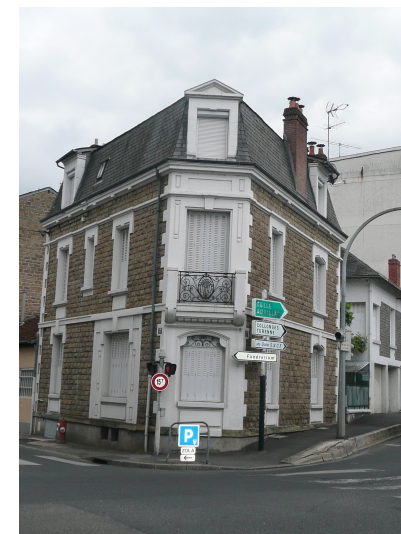
24 boulevard Louis Blanc