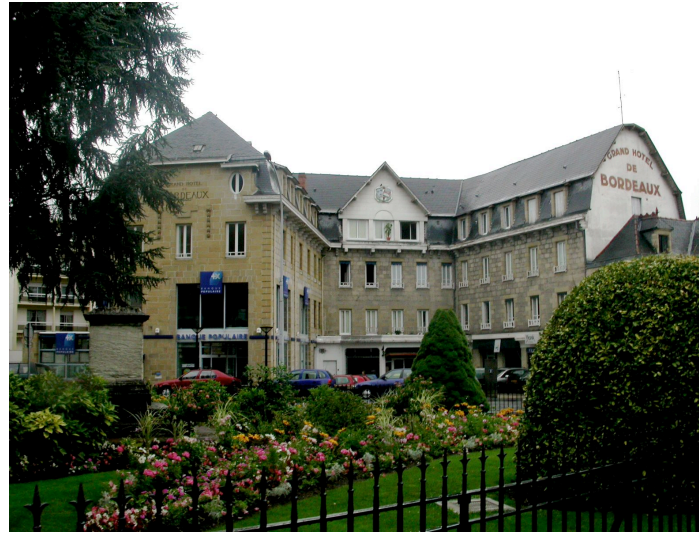
L'hôtel de Bordeaux 2 Av. du président Roosevelt après le deuxième incendie, reconstruit par Louis Macary en 1935.