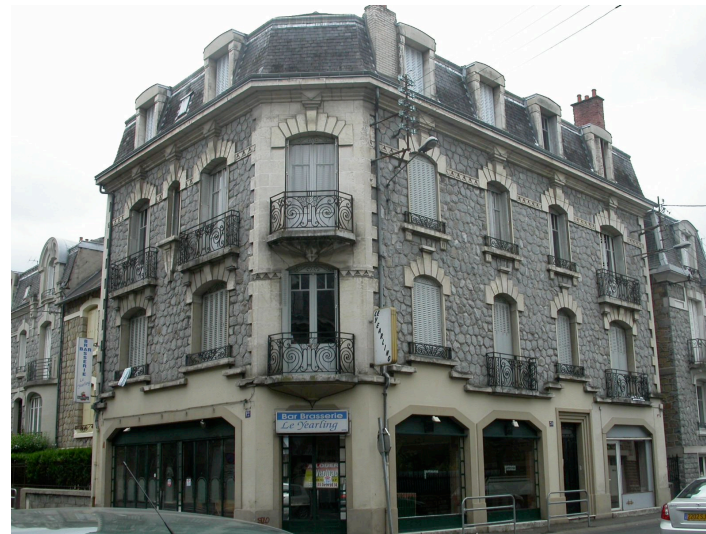
maison bloc 12 bis av. Alsace Lorraine 1930-1940