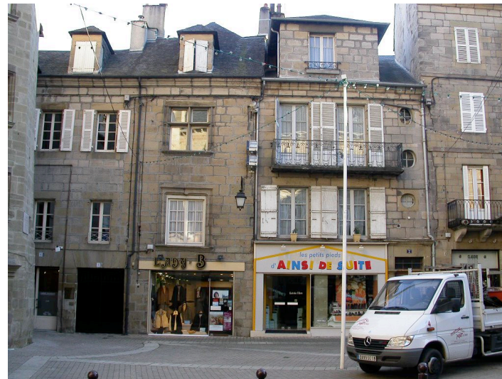
Hôtel de Quinhard de Maillard 2 place Latreille 1835 Immeuble construit sur une partie de l'hôtel de Quinhard