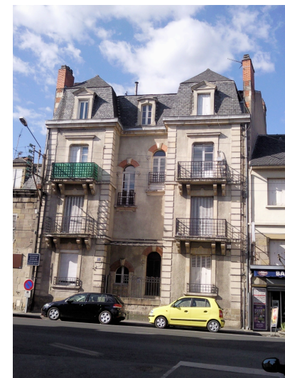
14 avenue Pierre Sémard Belle composition de façade