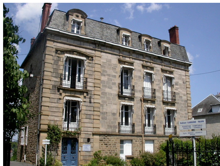
Maison bourgeoise 11 rue de la Fontaine Bleue Fin XIXème siècle