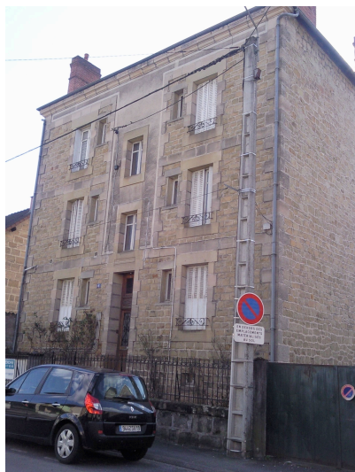
6 rue Emilie Lacoste Composition de la façade accentuée par le jeu des matériaux