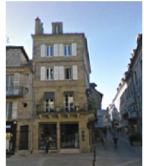
immeuble angle rue Faro et place Latreille