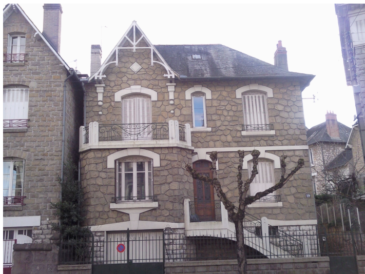
villa individuelle 1920-1940 19 Bd Louis Blanc