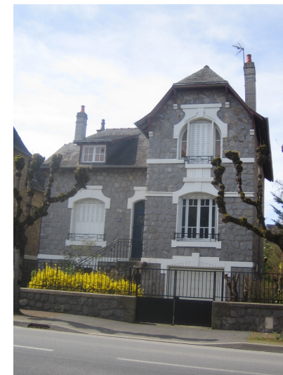
villa individuelle 1920-1940 39 boulevard Amiral Grivel