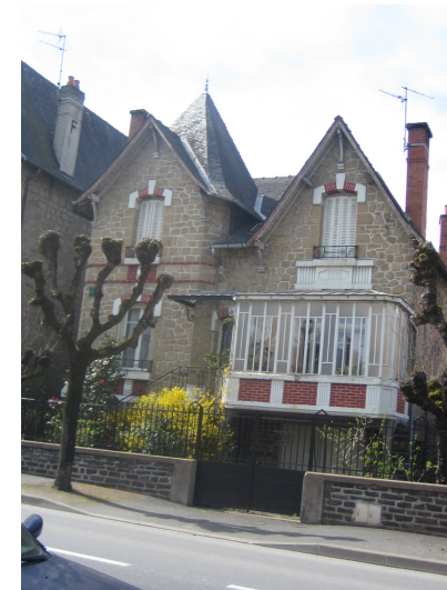
villa individuelle 1920-1940 43 boulevard Amiral Grivel