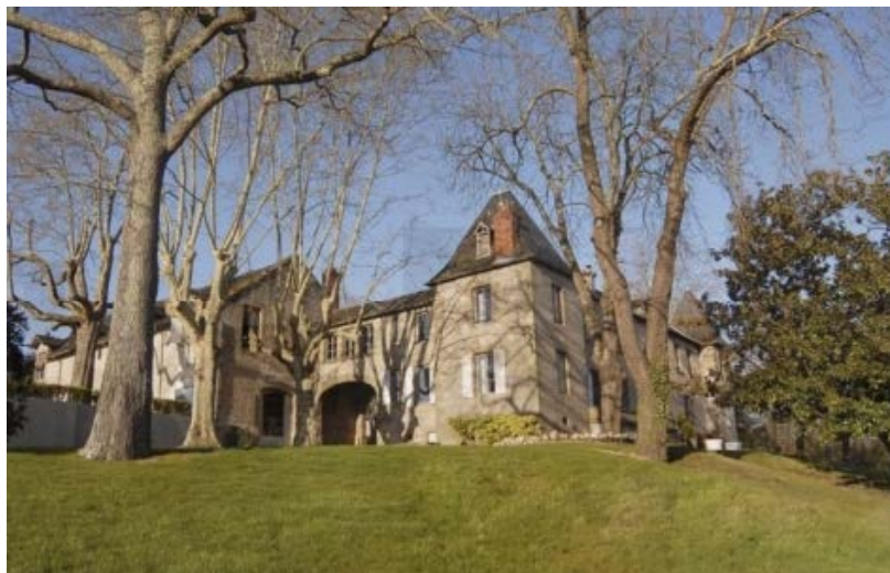
Chateau de Lacan rue Jean Macé