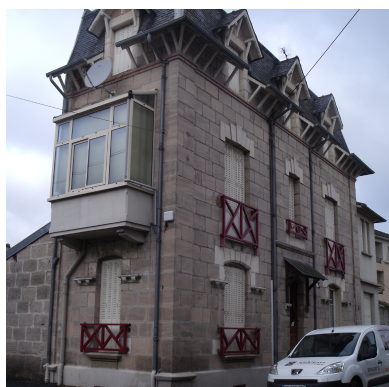
Ville individuelle 1900 8 rue de Fadat Maison en pierre Lucarnes, corniches, linteaux, fenêtres Particuliers