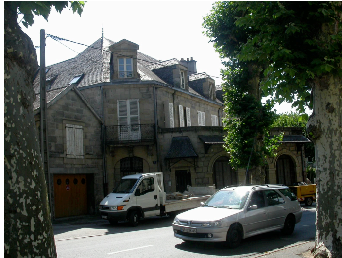
Hôtel particulier 5 Bd Edouard Lachaud XIX ème siècle