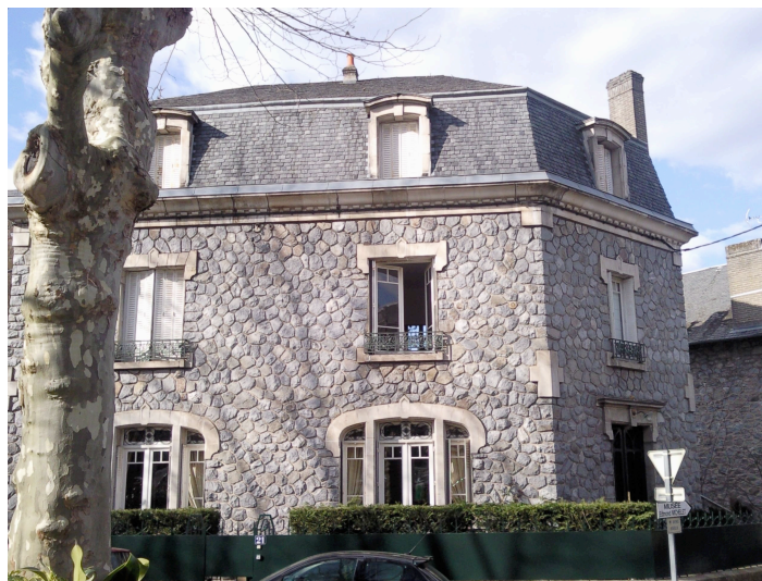
villa individuelle 1920-1940 21 square Gaston Hylaïre