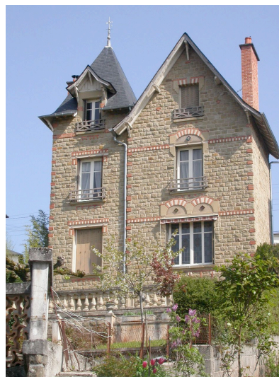
Villa individuelle 10 Av. du Printemps 1925 - Prosper VERLHAC Très belles décorations en briques