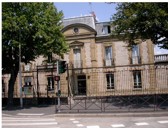
Ecole 1 Avenue Maillard Début XXème siècle