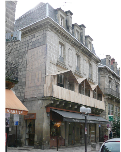
5 rue de l'Hôtel de Ville 1881