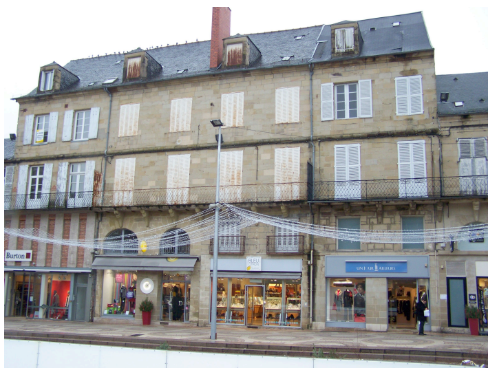
25, 27, 29, 31, 33, 35 et 37 rue de Toulzac, 1 rue Martine 1808, 1828, 1830

Série d'immeubles construits par les époux Latour-Crémeux entre 1805 et 1830. Balcon continu sur toute la longueur, daté 1808 et 1830 à l'angle des 2 rues, reposant sur consoles moulurées. Façades dénaturées par les commerces et lucarnes chien assis rajoutées.