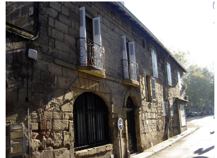
Maison individuelle 23 rue Blaise Raynal 1770-1772 2 maisons adossées ; l'une donnant sur la rue et l'autre sur un jardin