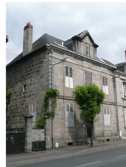
13 Boulevard Docteur Marbeau début XXème siècle Lucarne fronton