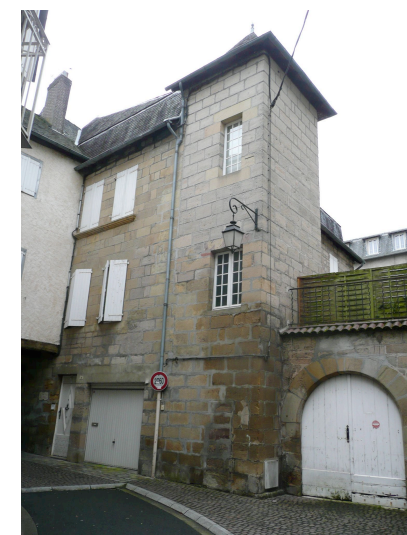
25 rue de la Jaubertie