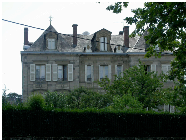
Hôtel particulier anciennement "Château Roque" Place Soeur Sophie Maillard 1870 - Louis Bonnay