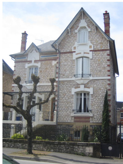
villa individuelle 1920-1940 35 boulevard Amiral Grivel