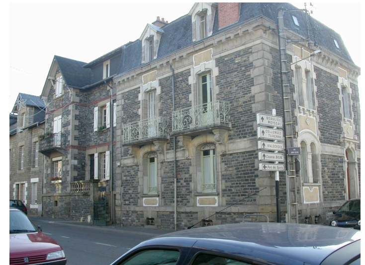
maison bloc 1 rue Jean Fieyre 1920-1940 polychromie des matériaux, encadrements travaillés