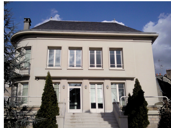
14 boulevard Edouard Lachaud