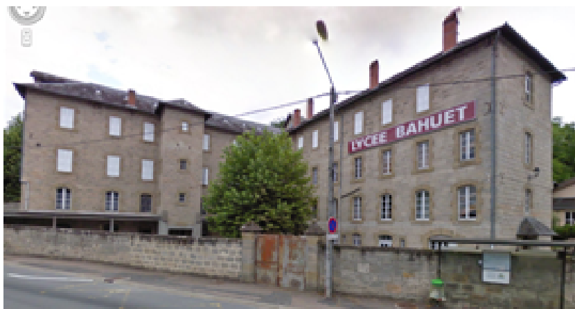
Saint Antoine Av Edmond Michelet