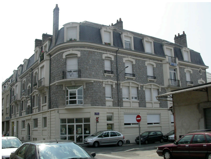
Immeuble collectif 1920-1940 (type 11) Angle rue Ernest Rupin et rue Fernand Alibert