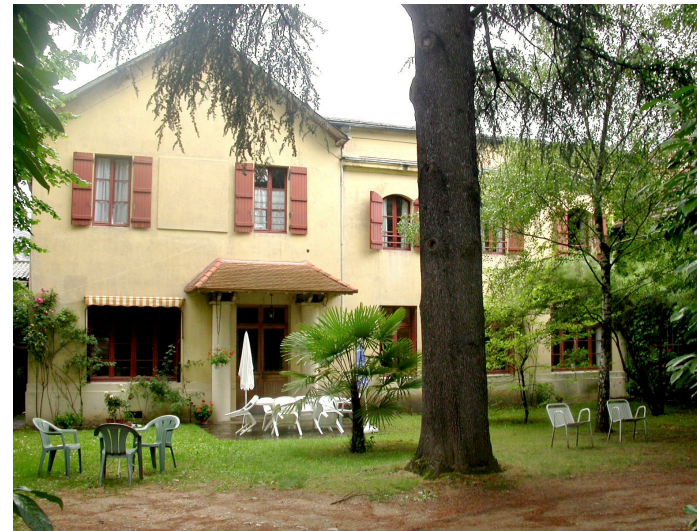
Ancienne fabrique de conserves alimentaires. 26 Av. du président Roosevelt Fin du XIXème siècle