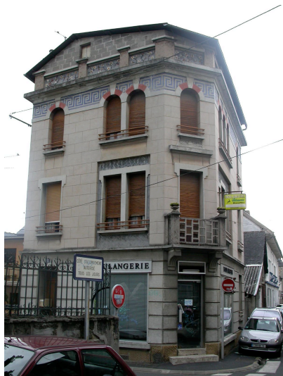
Immeuble style "art déco" 13 rue de Turenne 1930-1940 La toiture terrasse d'origine a été recouverte par une autre toiture.