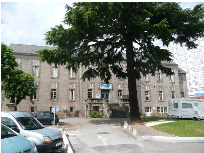
Bâtiments annexes de l'Hôpital début XXème siècle