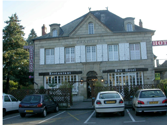
Ancien hôtel du Chapon Fin Place Delattre De Tassigny 1920-1930 Les oeils de boeufs des combles ont été remplacés par des lucarnes, de même que les garde-corps en ferronnerie du R +1 ont disparu.