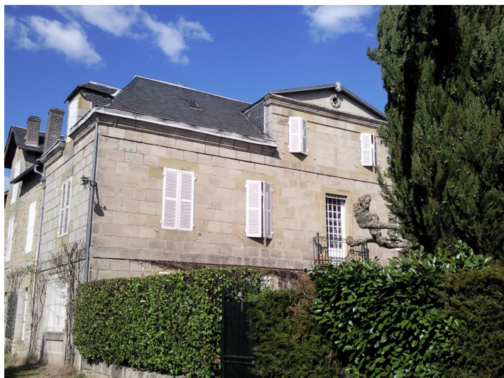
Hôtel particulier 13 Avenue Maillard XIXème siècle architecture classique