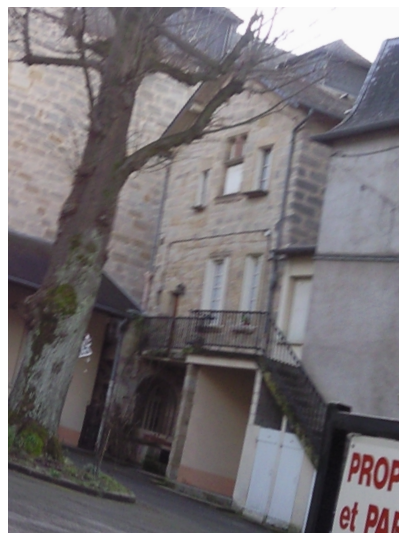
10 rue du Salan