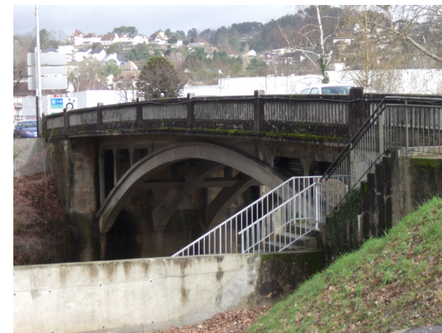
Pont du Buy Bd Michelet