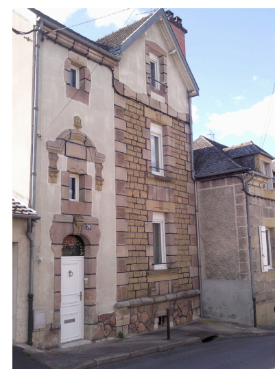
26 rue Diderot Polychromie des matériaux