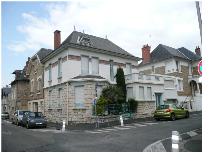
villa individuelle 1940-1950 11 bis avenue Firmin Marbeau feronneries et ouvertures intéressantes