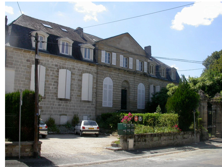
"château de la Bastille" rue Kléber 1751 élégant manoir de style Louis XV en péril, dont le superbe parc fut progressivement grignoté par la fièvre pavillonnaire et l'implantation des casernes.