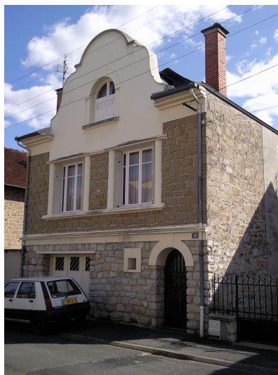
10 rue Jean Bosredon

Villa inspirée des villas de Georges Jean, avec utilisation du béton et de la pierre d'ardoise. Illusion d'une toiture terrasse.