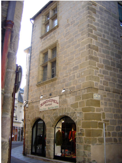
Maison 40 rue de Corrèze 1480-1510 parcelle morcellée; ne reste que le corps sur rue