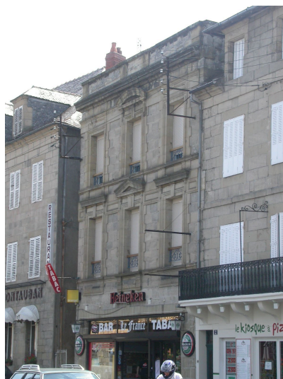
immeuble urbain 4 Av Edouard Herriot Début du XXème siècle Encadrements de fenêtres très travaillés, toiture terrasse