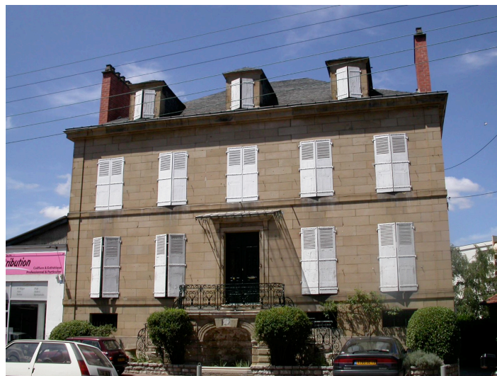
Maison bourgeoise - milieu du XVIIIème siècle 6 ter Av. du président Roosevelt Belle construction en grès fin de Grammont avec très bel escalier double et garde-corps en ferronnerie