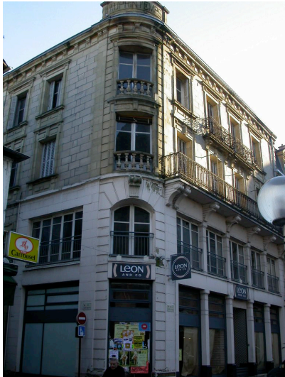
Grand magasin "au Printemps" 13 rue de l'Hôtel de ville 1897- Pierre Fournet Immeuble haussmannien