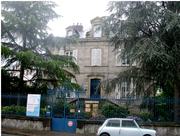
Petit Hôtel particulier 9 Av. du président Roosevelt XIXème siècle Le profil cintré des baies est une reprise des modénatures du XVIIIème siècle.