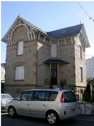
villa individuelle 1900-1920 13 rue Ferrier Volumétrie harmonieuse, entrée dans l'angle