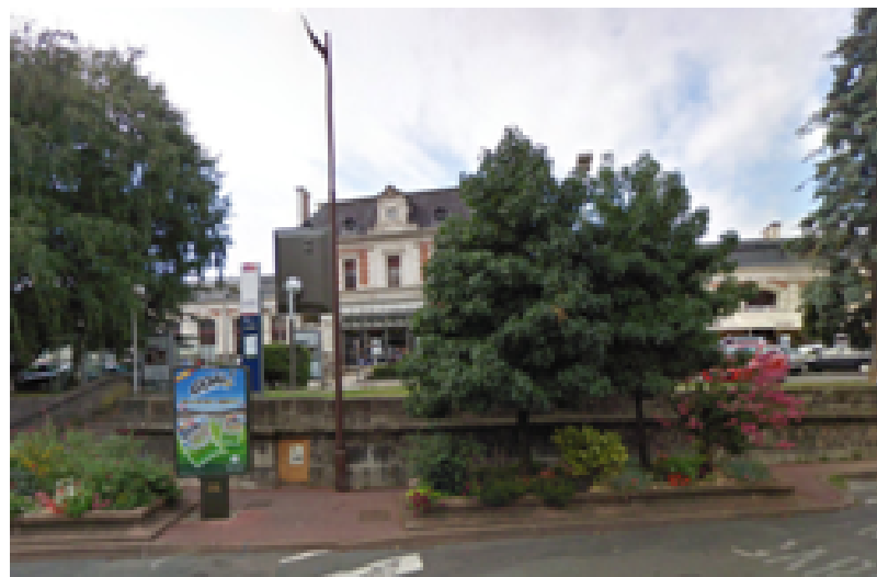
Halle de la Gare Avenue Jean Jaurès