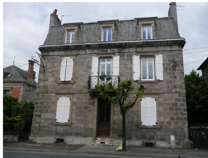
11 Boulevard Docteur Marbeau début XXème siècle ardoise de pays en écaille