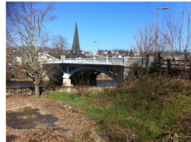
Pont de la Bouvie Bd Mirabeau