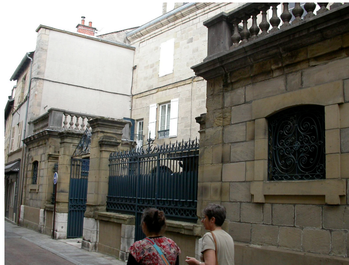
maison Mage 10 place des Patriotes-Martyrs, rue de Corrèze 1835, 1889, 1894 Maison reconstruite suite à un incendie en 1889, excepté la façade sur la place. Aménagement d'une cour et de 2 constructions sur la rue de Corrèze.