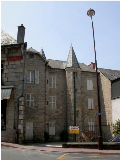
Bâtiment de "l'Union Compagnonnique" 28 Av. Jean- Jaurès - 19 av F.Marbeau 1904 Immeuble à tourelle