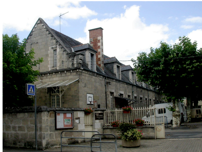
Ecole de la Salle 1880 Avenue Thiers